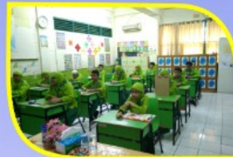
Ruang Kelas Ber AC