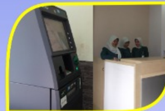
Payment Point dan ATM